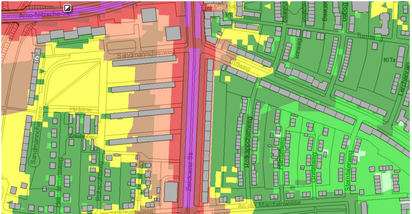
Beispiel Zwickauer Straße in Leipzig/Marienbrunn: Rechts schützt der geschlossene Blockrand den Innenhof und das Siedlungsgebiet in der ‚zweiten Reihe‘. Auf der linken Straßenseite kann sich der Verkehrslärm aufgrund der losen Zeilenbauweise nahezu ungehindert ausbreiten.